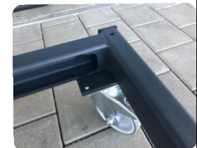
Lenkrollen geschraubt auf massiver Flanschplatte