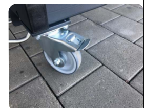
4 Stück Lenkrollen D-125mm mit Feststeller