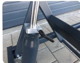
Hydraulikeinheit mit Feststeller